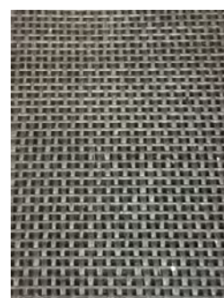
Svart, UV-beständig duk